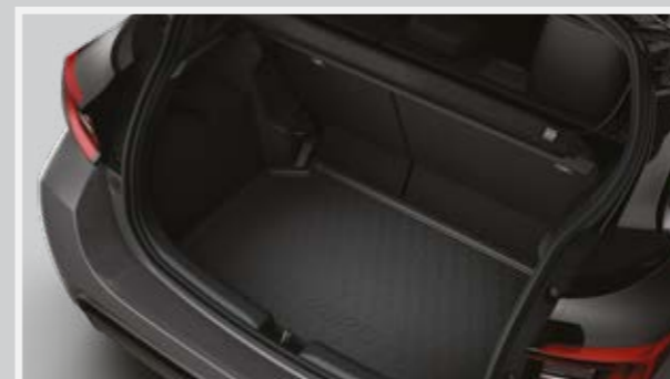
פסי הגנה לדלתות ואמבטיה לתא מטען המספקים הגנה מפני שריטות ופגיעות קוסמטיות