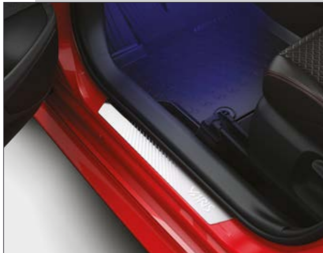
סט קישוטי סף קדמיים מקוריים היוצרים רושם מידי של סטייל, ובמקביל מגנים על סף הדלת מפני לכלוך ושריטות