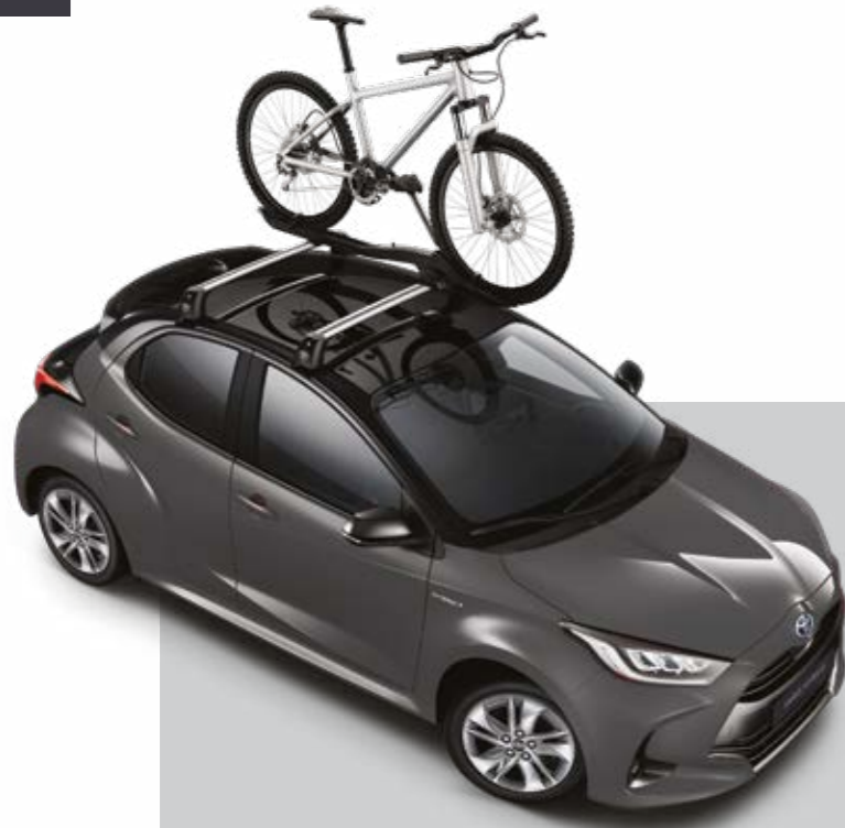
מוטות רוחב, עבור מגוון אביזרי גג ומתקני אופניים