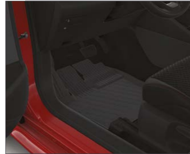
שטיחי גומי המגנים על פנים הרכב מפני לכלוך וניתנים להסרה ולניקוי פשוט