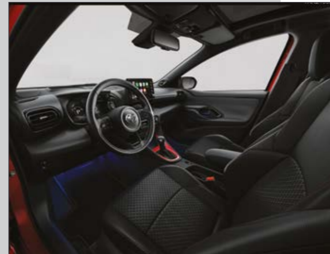
קישוט קונסולה מרכזית בצבע אדום שיהפוך את היאריס שלך לייחודית מבפנים כפי שהיא מבחוץ