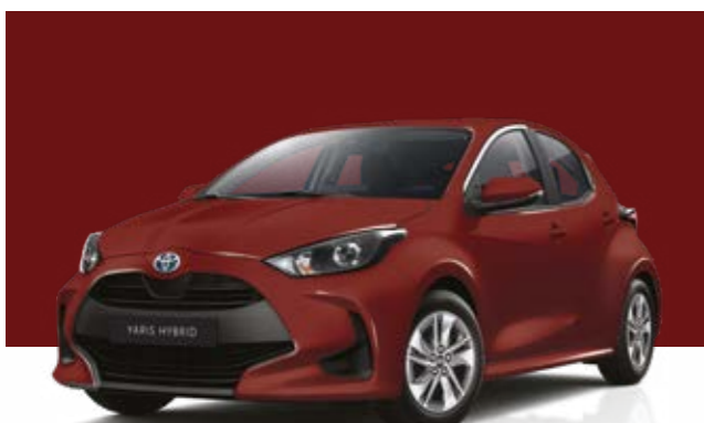
אדום רוז מטאלי 3U5