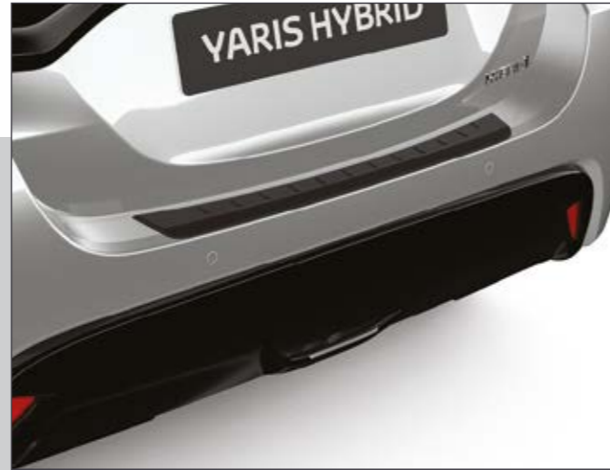
מגן פגוש אחורי המגן על הפגוש בעת טעינה ופריקה של סחורה מתא המטען