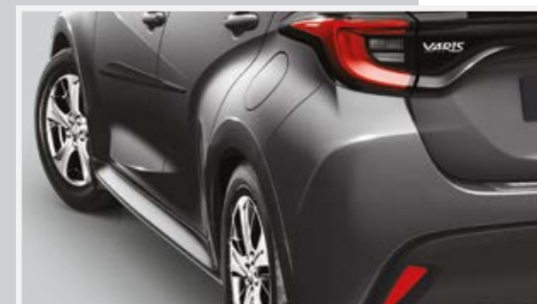
פסי הגנה לדלתות ואמבטיה לתא מטען המספקים הגנה מפני שריטות ופגיעות קוסמטיות