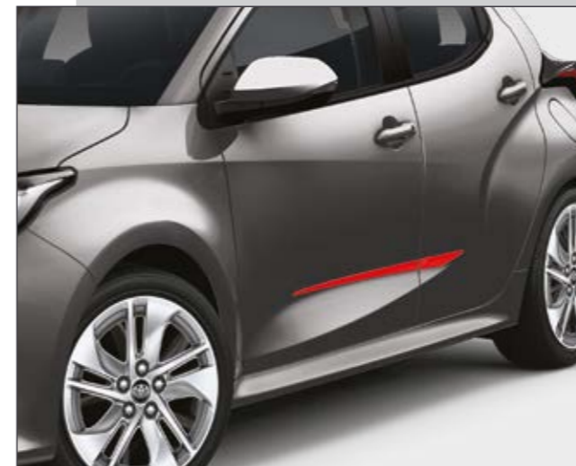
סט פסי קישוט בצבע אדום שייגרמו לראשים להסתובב בזכות נגיעת הצבע הנועזת שהם מוסיפים לרכב