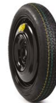
ערכת גלגל רזרבי וקומפקטי לניצול מקסימלי של נפח תא המטען