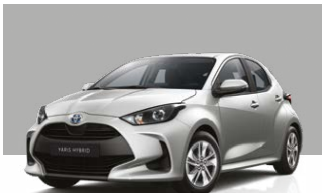
כסוף מטאלי 1L0