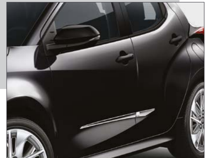
סט פסי קישוט בצבע כרום שייספקו ליאריס שלך מראה קלאסי בעל נגיעה אלגנטית