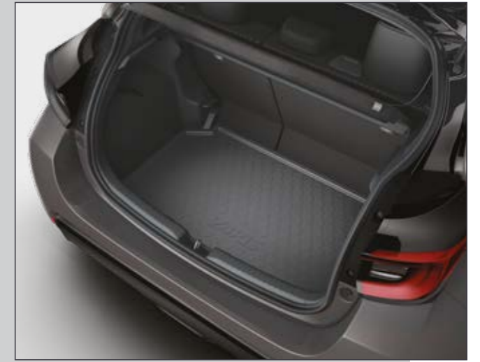
אמבטיה לתא המטען המספקת הגנה מפני לכלוך ומפני החלקה של ציוד וסחורה