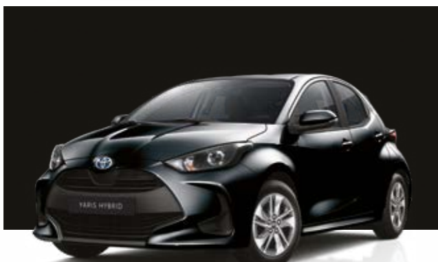
שחור מטאלי 209