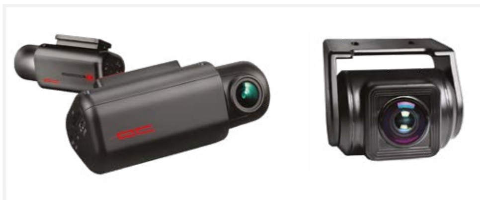
מצלמת DVR מצלמת דרך קדמית ואחורית מתעדת כל אירוע בכביש