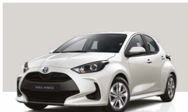
לבן פנינה מטאלי 089