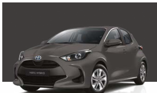
אפור מטאלי 1G3