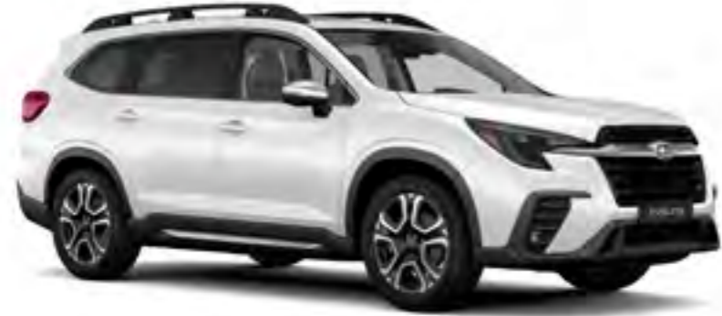
Crystal White Pearl

08 19 מחזיקי כוסות ובקבוקים* | 19 מחזיקי כוסות ובקבוקים זמינים בתוך הרכב, לנוחיותם של כל הנוסעים.