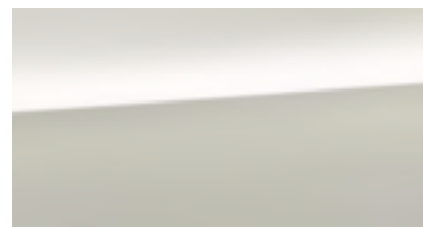
Crystal White Pearl