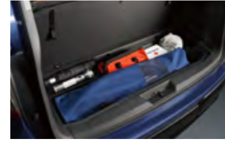
אזור אחסון מתחת לרצפה

הגרסה העדכנית ביותר של מערכת EyeSight*1 מעניקה לנהג ביטחון ושקט נפשי על הכביש. מצלמה רחבת זווית הפועלת בשילוב עם מערך המצלמות הקדמיות לקבלת שדה ראייה רחב יותר, מאפשרת זיהוי מוקדם של הולכי רגל ואופניים בעת כניסה לצומת במהירות נמוכה. הזיהוי המוקדם בעזרת המצלמה ותוספת מגבר הבלם האלקטרוני משפרים את ביצועי הבלימה לפני התנגשות ומגדילים את טווח הפעולה של המערכת.