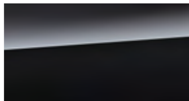
Crystal Black Silica