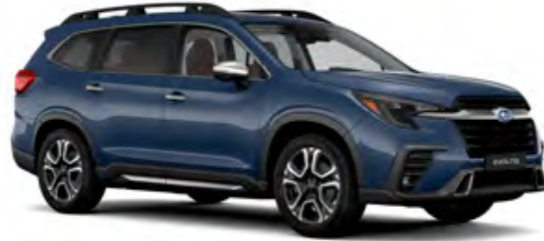
Cosmic Blue Pearl