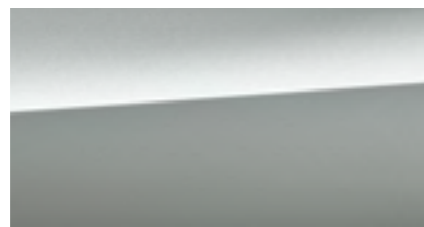
Ice Silver Metallic