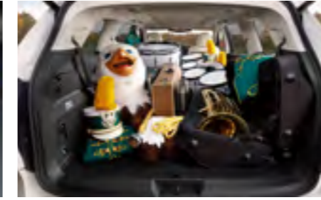
מרחב מטען נדיב