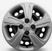
כיסויי גלגלים 15" (LT+)