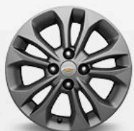
חישוקי אלומיניום 15" (Premier, LTZ)