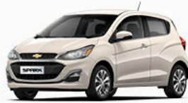
חום סהרה מטאלי (GV8)