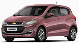
ורוד אפרפר מטאלי (GHN)