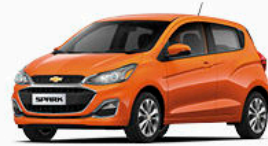
כתום הדר מטאלי (GL5)