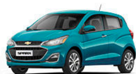
כחול קריבי מטאלי (GZ0)