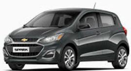
אפור כהה מטאלי (GK2)