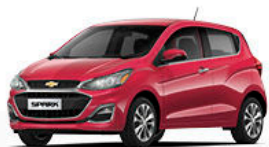
אדום פטל מטאלי (GU0)