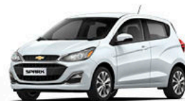
לבן פסגה (GAZ)