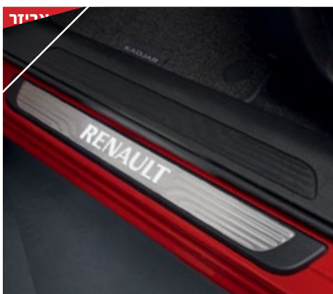
זוג מדרכי סף דלת עם כיתוב Renault מואר LED לבן. LP00013710