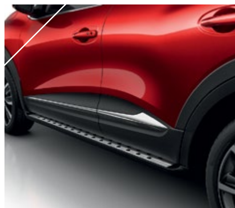
זוג מדרכות צד דקורטיביים LP00013708

האביזרים המופיעים בעמוד זה הינם בתשלום נוסף.