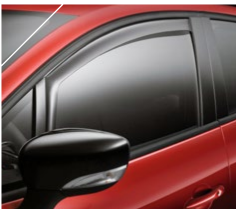
זוג מסיטי רוח קדמיים לנהיגה בנוחות מלאה עם חלונות פתוחים. LP00013718