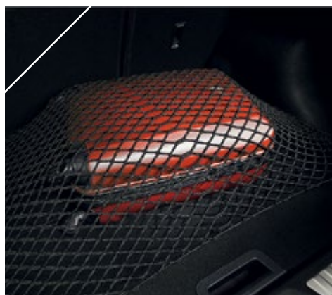
רשת חפצים לתא מטען LP00013720