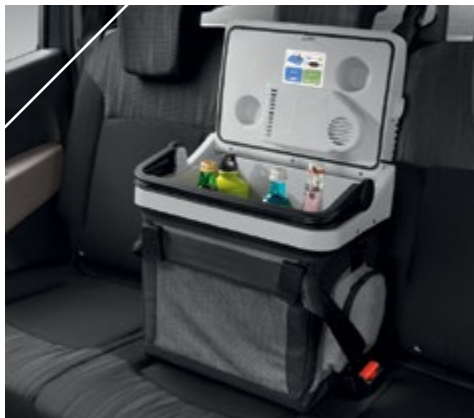
קירורית ניידת 20 ליטר , חיבור למצת הרכב, 12 וולט. LP00011541

אביזרים נוספים אתה מוזמן לאבזר את הרכב שלך ולהפוך אותו לייחודי, עם מגוון אביזרים לבחירה: