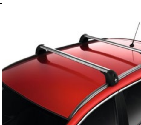
גגון אלומיניום אווירודינמי 2 מוטות רוחביים על גג הרכב, לנשיאת מטען של עד 75 ק"ג. LP00013721 לקשתות אורך LP00013829 ללא קשתות אורך.