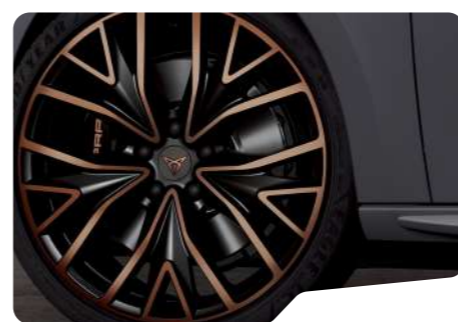
PYA 19" 5