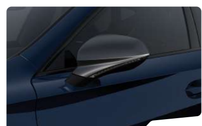
כחול אספלט 5U5U