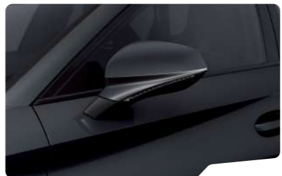
אפור מטאלי S7S7