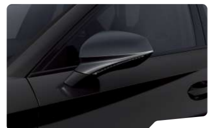
שחור מטאלי OE0E