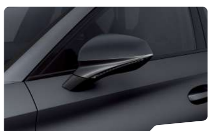
אפור מט 9R9R