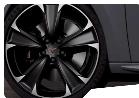
STD 19" 5