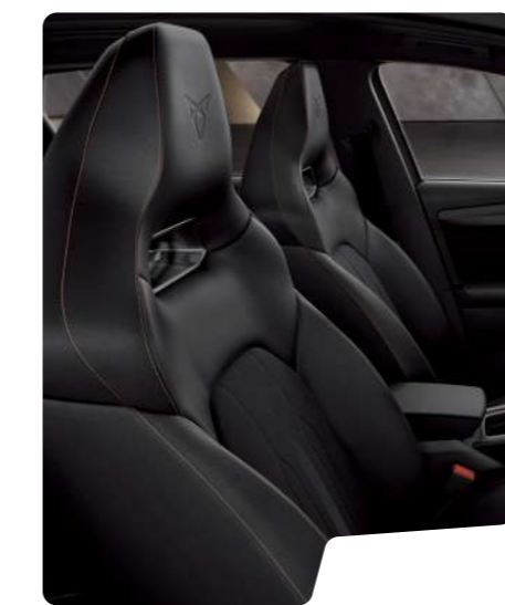
מושב באקט 5