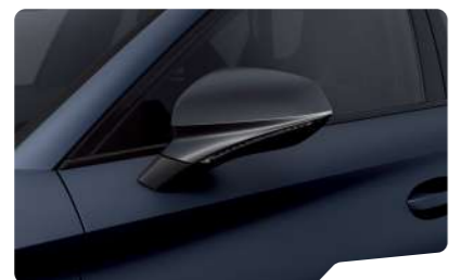
כחול מט Q4Q4