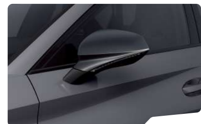
אפור גרפיט R6R6