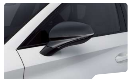
כבן נבדה 2Y2Y