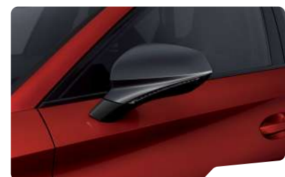
אדום כהה יין E1E1