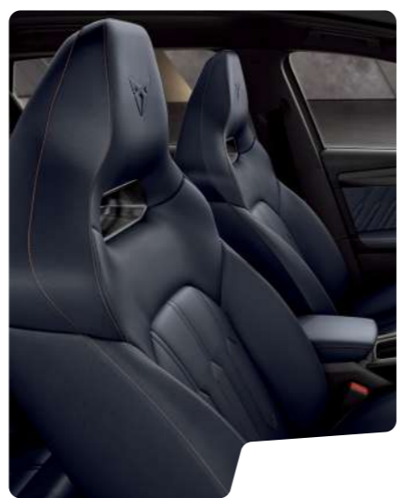
מושב באקט עור כחול 5