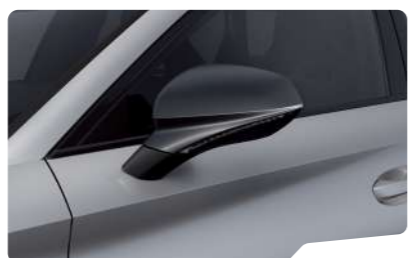
כסוף מטאלי L5L5