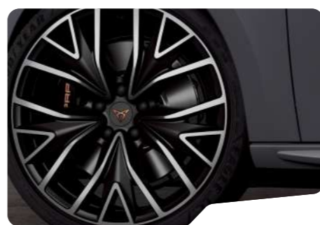
PYB 19" 5