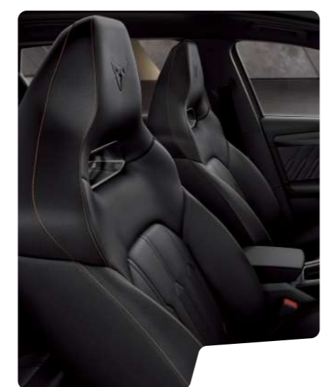
מושב באקט עור שחור 5