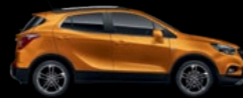
GL5 - Amber Orange