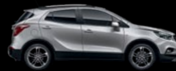
GAN - Sovereign Silver