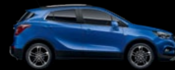
GQM - Borocay Blue