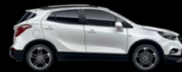
GAZ - Summit White