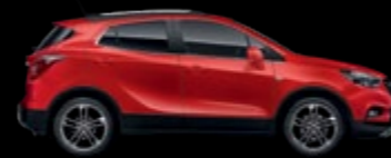
GG2 - Absolute Red