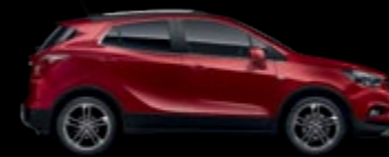
GCS - Velvet Red