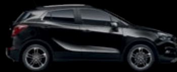
GBO - Minearal Black