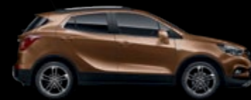
GD7 - Country Brown