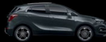
GK2 - Quantum Grey