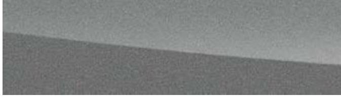
SONIC TITANIUM | 1J7