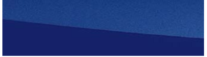
CELESTIAL BLUE | 8Y6