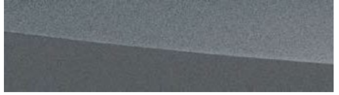
SONIC PLATINUM | 1L2