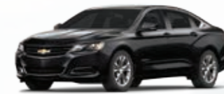
שחור כוכב מטאלי (GB8)