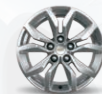
18" סגסוגת (סטנדרטי ב-LT)