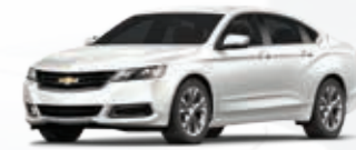
לבן פנינה (G1W)*