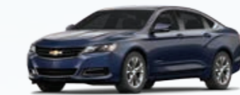
כחול קטיפה מטאלי (G1M)