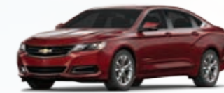
אדום קריסטל (G1E)*