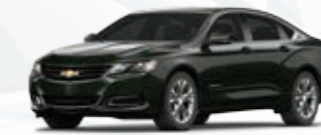
ירוק כהה מטאלי (GC8)*