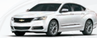
לבן פסגה (GAZ)