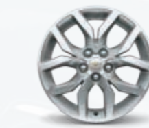
19" סגסוגת מבריקה