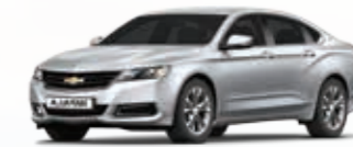
כסף מטאלי (GAN)