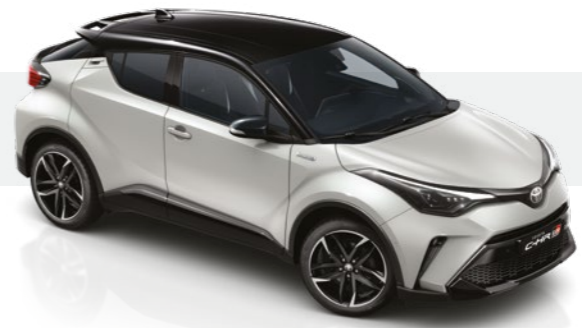
לבן דינמי / שחור 2VF - 202/1K6