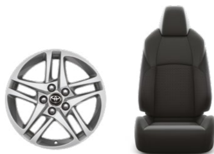
חישוקי סגסוגת קלה 17" ריפוד בד מהודר בצבע שחור