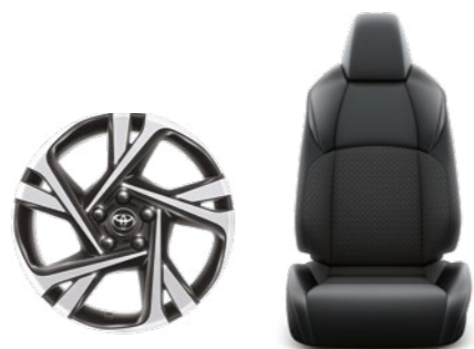
חישוקי סגסוגת קלה 18" ריפוד בד משולב עור מלאכותי בצבע שחור