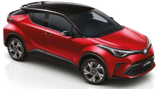
אדום עז / שחור 2TB - 202/3U5