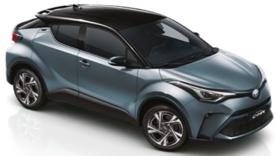
אפור תכלת / שחור 2TH - 202/1K3