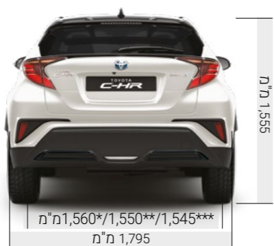
מ"מ 1,560*/1,550**/1,545*** מ"מ 1,795