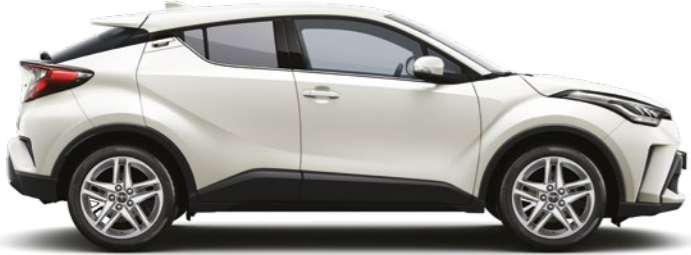
לבן פנינה מטאלי 089