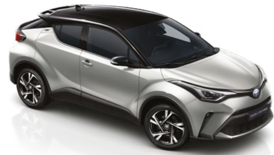
כסוף מטאלי / שחור 2VU - 202/1L0