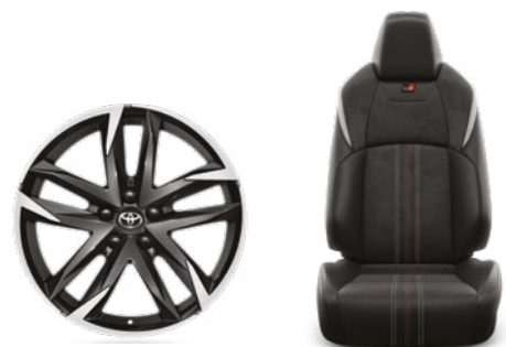
חישוקי סגסוגת קלה 19" עם ריפוד אלקנטרה ספורטיביים