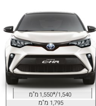
מ"מ 1,550*/1,540 מ"מ 1,795