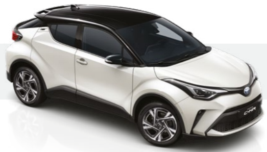
לבן פנינה / שחור 2VP - 202/089