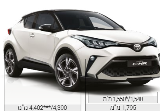
מ"מ 4,402***/4,390 מ"מ 1,550*/1,540 מ"מ 1,795

*מתייחס לדגם C-ITY. **מתייחס לדגם C-HIC. ***מתייחס לדגם GR SPORT