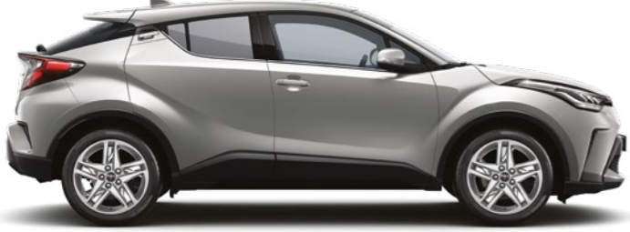
כסוף מטאלי 1L0