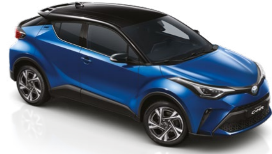
נחול פיג'י / שחור 2NH - 202/8X2