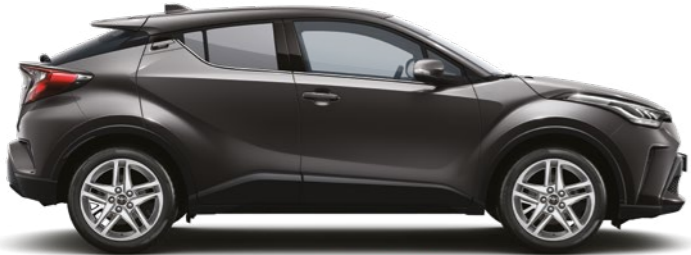
אפור גרניט מטאלי 1G3