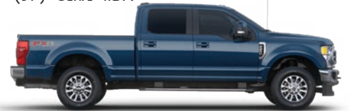
כחול ג'ינס (N1)