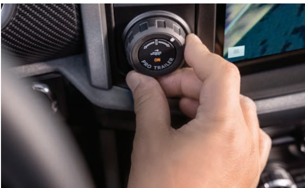
– Ford Pro Backup Assist מערכת עזר לנסיעה לאחור עם נגרר