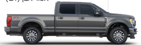
אפור מגנטי (J7)