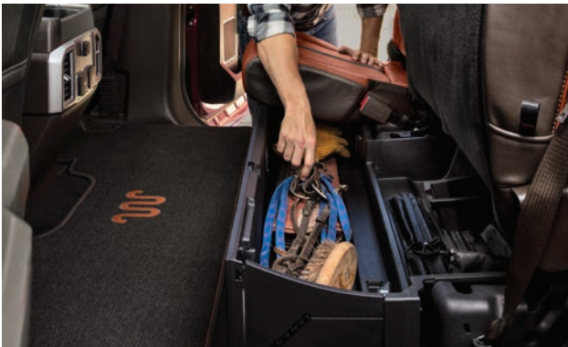
תא אחסון מתקפל נסתר מתחת למושב האחורי (בדגמי Crew cab קבינה כפולה בלבד)