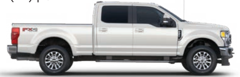
לבן נוצץ* (A2)