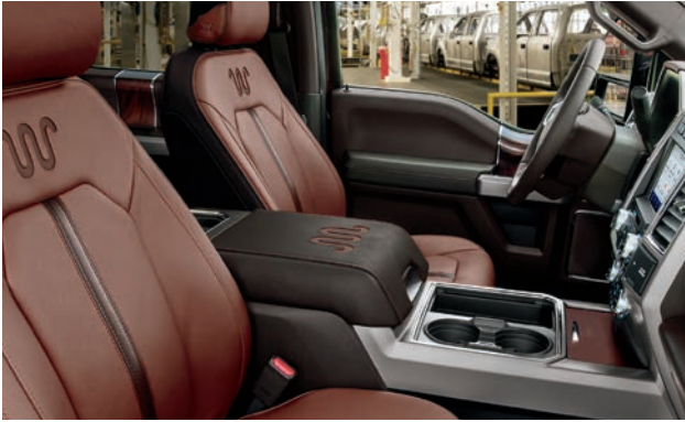
חלל פנימי עשיר ואלגנטי (בתמונה – חלל פנימי King Ranch)