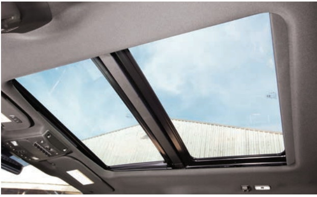
חלון שמש פנורמי Sunroof