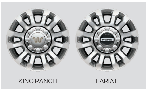
חישוק אלומיניום יצוק 18"