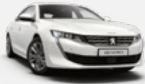
BANQUISE | לבן | WPPO