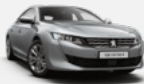
ARTENSE GREY | כסוף כהה מטאלי | F4M0