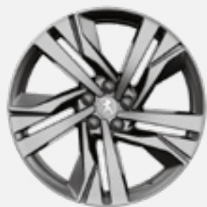
חישוק סגסוגת AUGUSTA 19" סטנדרט לדגמי GT