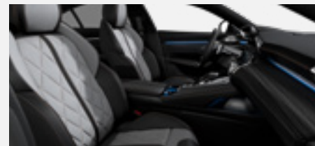
מושבים בריפוד עור Mistral Nappa משולב אלקנטרה (בגרסת ה-PHEV)