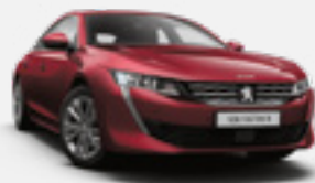
RED ULTIMATE | אדום כהה מטאלי | F3M5