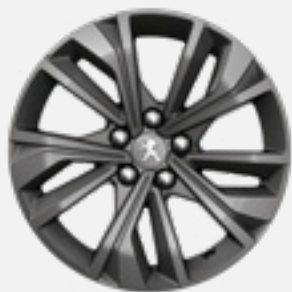
חישוק סגסוגת MERIONE MAT 17" לבחירה בדגמי PREMIUM