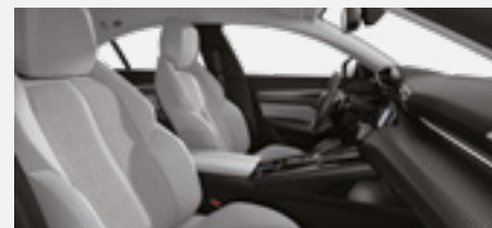
ריפוד פנימי וגימור דלתות בצבע אפור בהיר