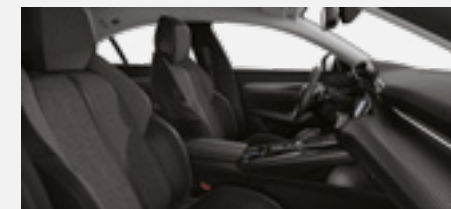
ריפוד פנימי וגימור דלתות בצבע אפור כהה