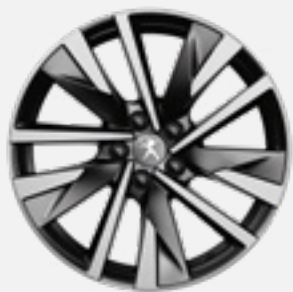
חישוקי סגסוגת SPERONE 18" לדגמי PHEV