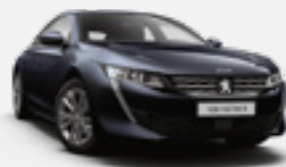
DARK BLUE | כחול כהה מטאלי | KUM0