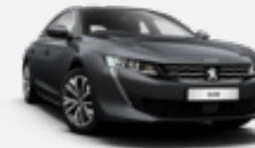
HURRICANE GREY | אפור כהה | OGP9

בחרו את הצבע שלכם * צבע מטאלי בתוספת תשלום