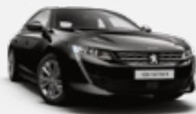
PERLA NERA BLACK | שחור מטאלי | 9VM0