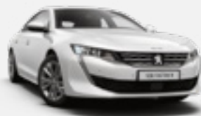
PEARLESCENT WHITE | לבן פנינה מטאלי | N9M6