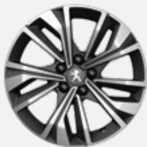
חישוק סגסוגת MERIONE DIAMOND 17" לבחירה בדגמי PREMIUM