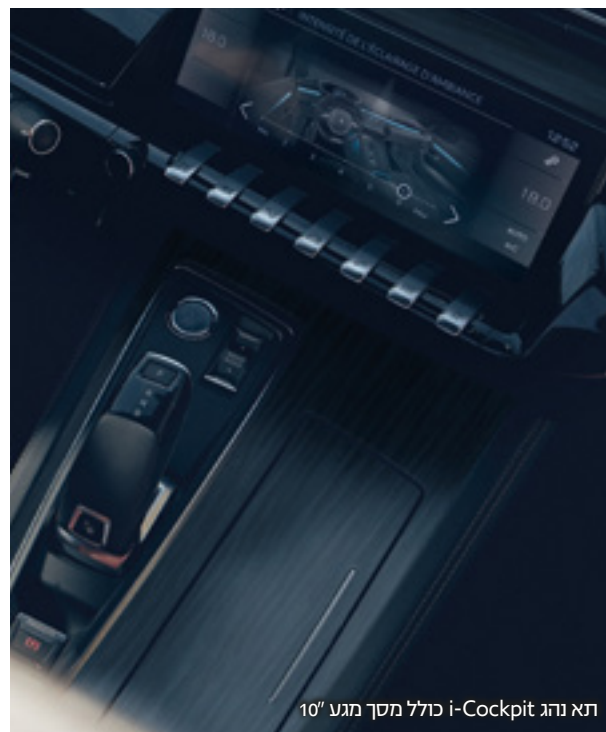
תא נהג i-Cockpit כולל מסך מגע 10"