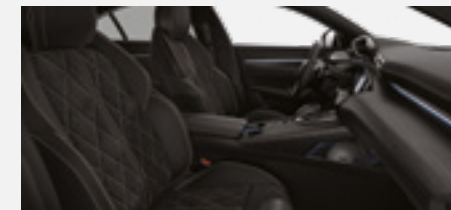
מושבים בריפוד עור Mistral Nappa משולב אלקנטרה (בגרסת הבנזין)