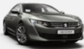
AMAZONITE GREY | אפור ירקרק מטאלי | KLM0