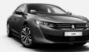
PLATINIUM GREY | אפור כהה מטאלי | VLM0