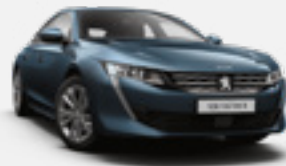
CELEBES BLUE | כחול בהיר מטאלי | SYM0