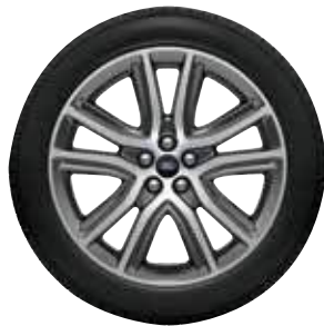
חישוק סגסוגת קלה 20" דו גווני