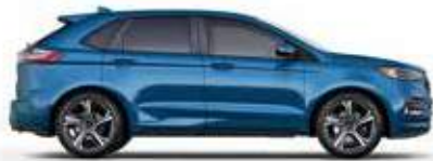
כחול מרצים (FM) זמין ברמת גימור ST