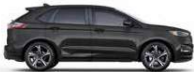
אפור מגנטי (J7)