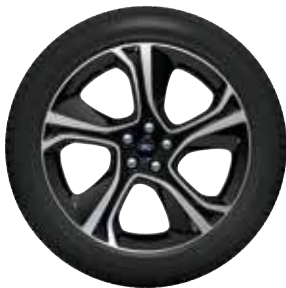
חישוק סגסוגת קלה 20" דו גווני ST