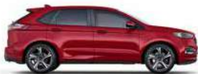
אדום לוחט (RR)*