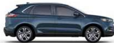
כחול מטאלי (FT)