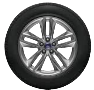
חישוק סגסוגת קלה 18"