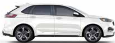
לבן פלטינה (UG)*