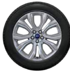
חישוק סגסוגת קלה 19"