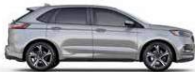
כסף מטאלי (UX)