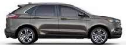
אפור אבן (D1)

לתשומת ליבך! דוגמאות הצבעים בעלון זה מוצגות לשם המחשה בלבד. בשל מגבלות הדפוס, תתכנה סטיות מהצבעים והחומרים בפועל. היצע הצבעים כפוף לשינויים אפשריים על פי מדיניות היצרן ולמגבלות המלאי. פנה לנציג מכירות לקבלת מידע עדכני.