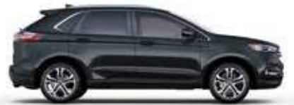
ירוק ים (BG)