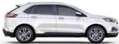
לבן (YZ) זמין ברמת גימור SEL PLUS