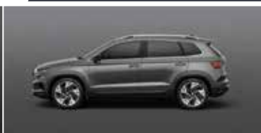
GRAPHITE GREY (5X)