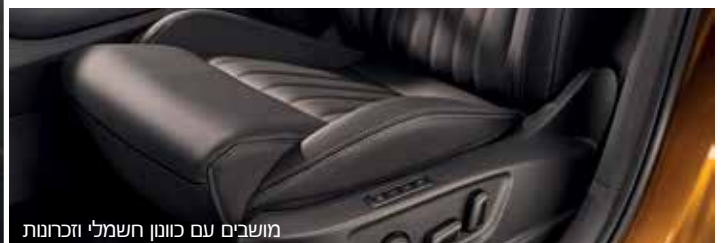
מושבים עם כוונן חשמלי וזכרונות