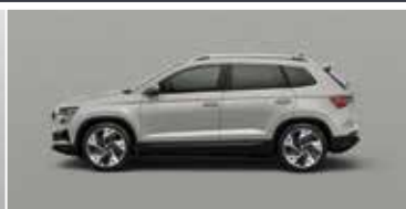
STEEL GREY (M3)