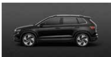
MAGIC BLACK (1Z)