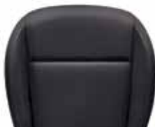
ריפודי בד - שחור