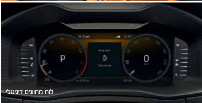
לוח מחוונים דיגיטלי