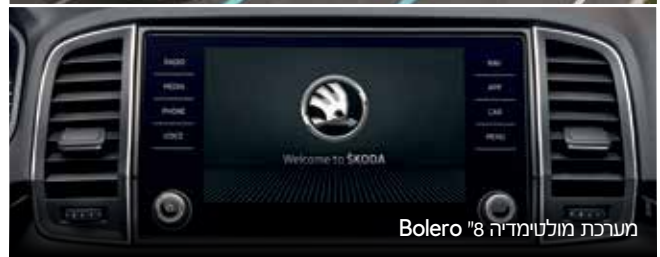
מערכת מולטימדיה "8 Bolero