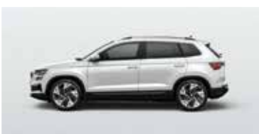
MOON WHITE (2Y)