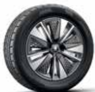
חישוקי סגסוגת "17 SCUTUS