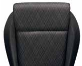
ריפודי בד - שחור