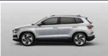
BRILLIANT SILVER (8E)