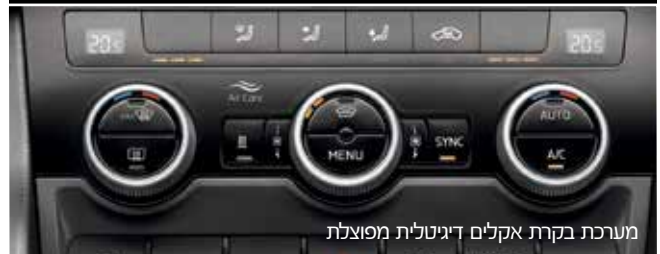
מערכת בקרת אקלים דיגיטלית מפוצלת