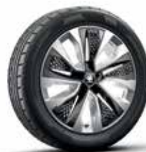
חישוקי סגסוגת PROCYON "18"