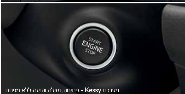
מערכת Kessy - פתיחה, נעילה והנעה ללא מפתח