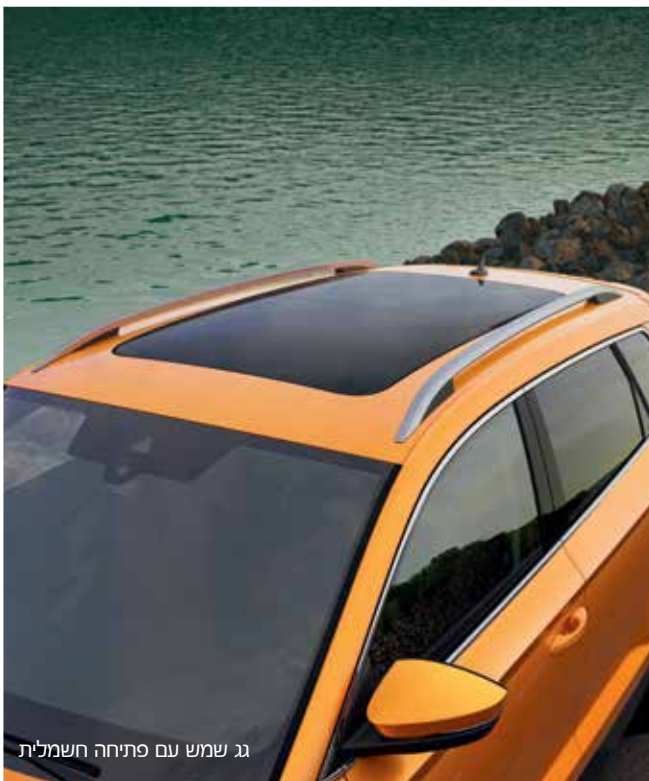
גג שמש עם פתיחה חשמלית