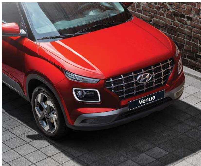
חזית במראה אגרסיבי עם גריל מעוצב*