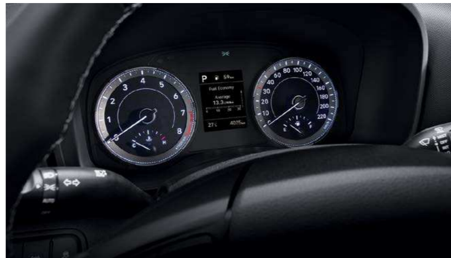
לוח מחוונים דיגיטלי 3.5"