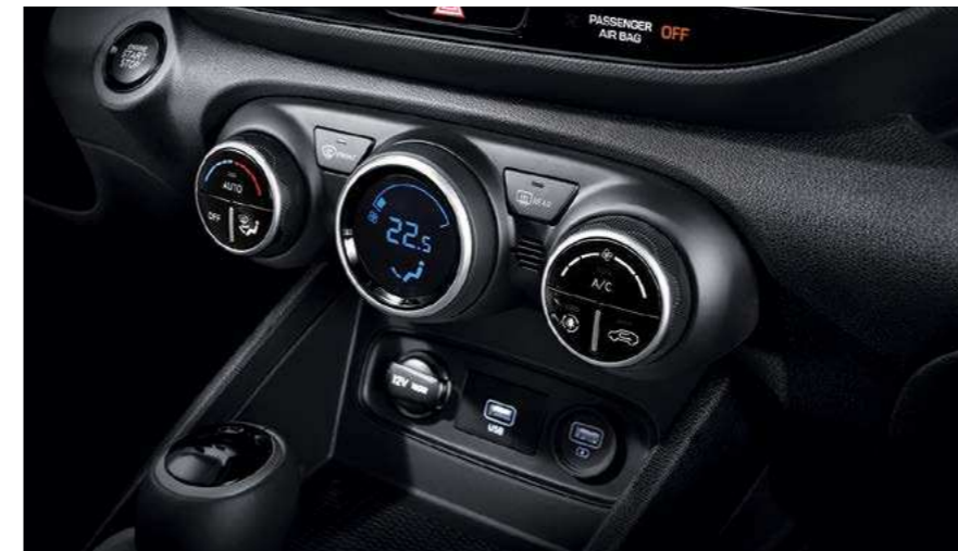
מערכת בקרת אקלים דיגיטלית**