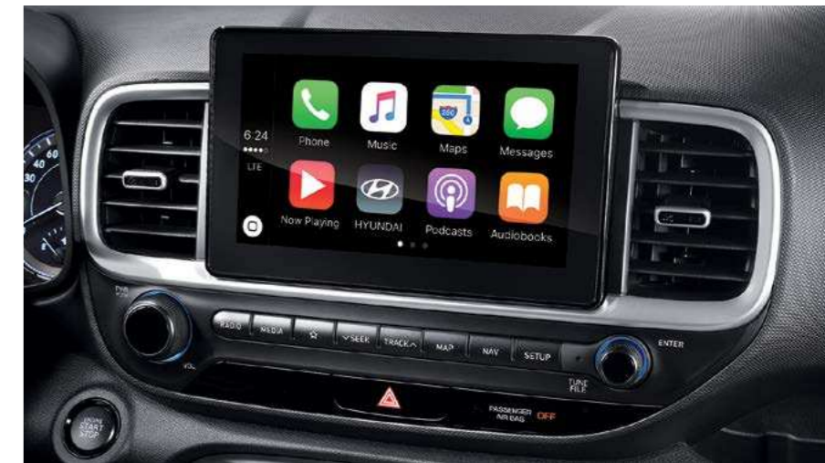
מערכת מולטימדיה מקורית 8" עם אפשרות חיבור למערכת *Android Auto, Apple Carplay