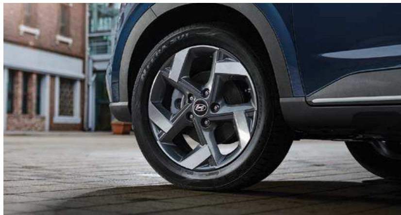
חישוקי סגסוגת "17"

יונדאי VENUE מסובב ראשים בכל פנייה. עם עיצוב חיצוני בולט הכולל גריל מעוצב עם עיטורי כרום* במראה אגרסיבי לצד פנסים מעודנים בקווים אלכסוניים.