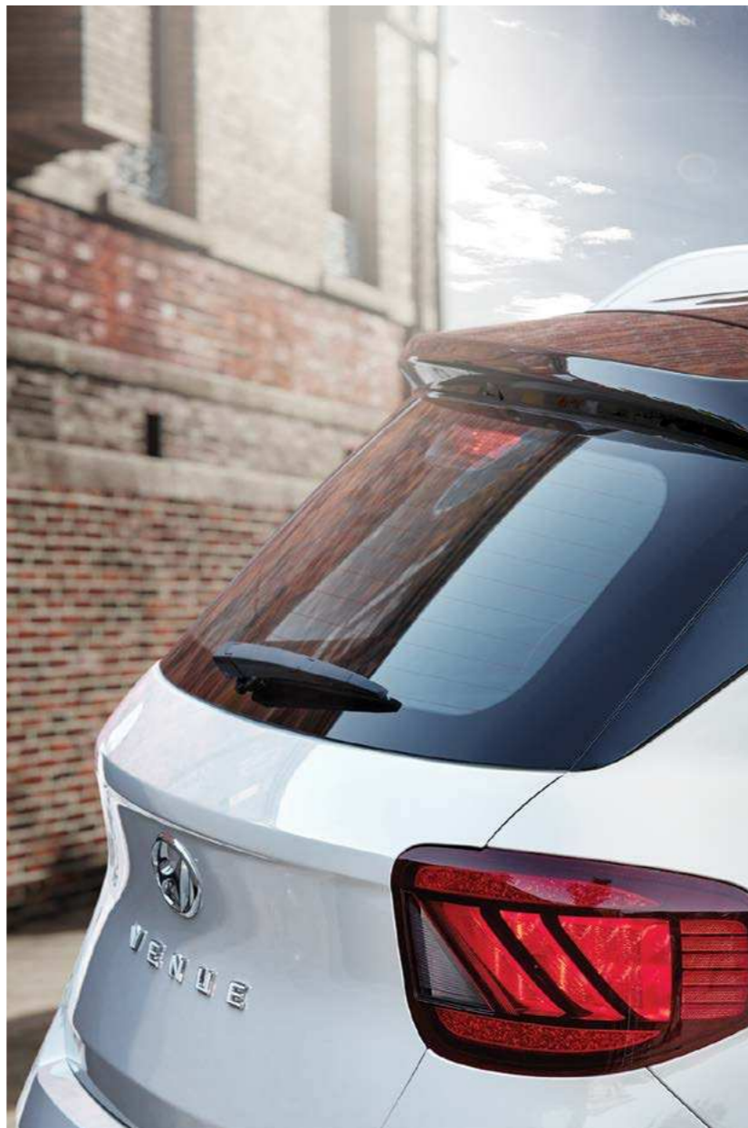
פנס אחורי בעל עדשה מעוצבת במראה אלכסוני