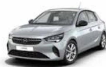
כסוף מטאלי | Aluminium Grey (בדגמי Edition ו-e-Elegance בלבד)