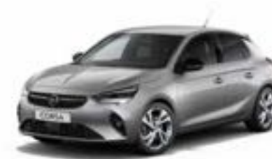
כסוף כהה מטאלי | Artense (בדגם GS Line בלבד)