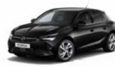
שחור מטאלי | Black Perla