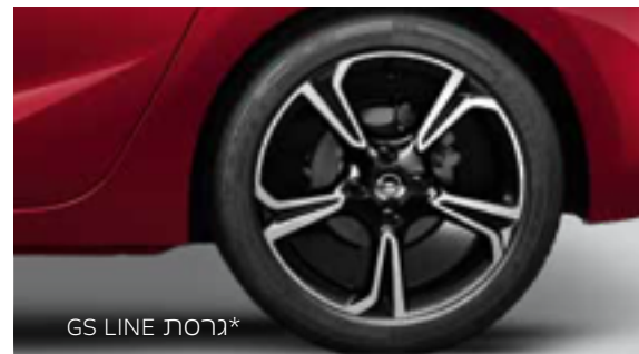
*גרסת GS LINE