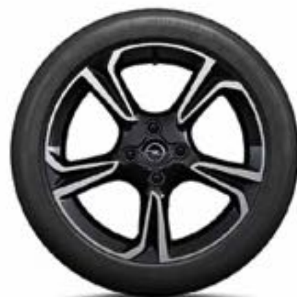
חישוקי סגסוגת 17" לדגמי GS Line ו-e-Elegance