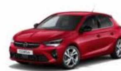
אדום מטאלי | Peperoncino Red