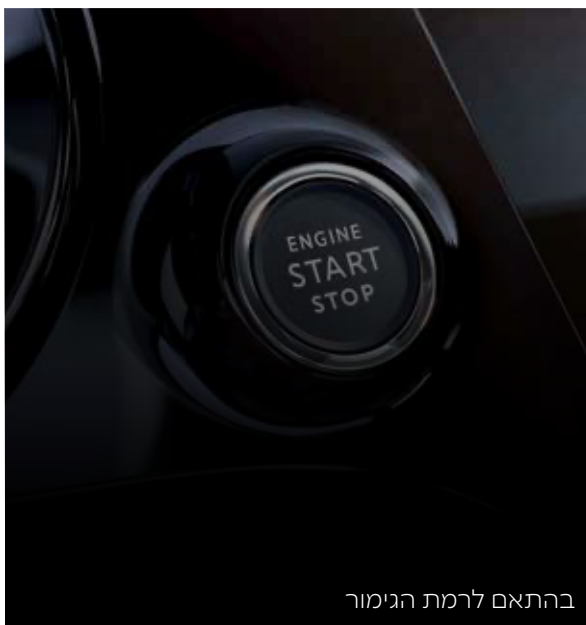
בהתאם לרמת הגימור