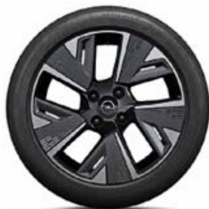
חישוקי סגסוגת 17" לדגמי e-Elegance