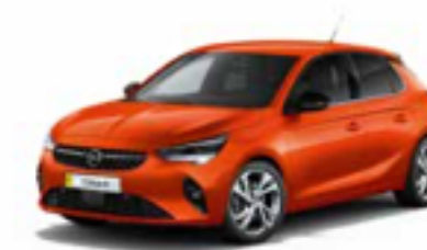
כתום מטאלי | Orange Fizz (בדגמי Edition ו-E-Elegance בלבד)