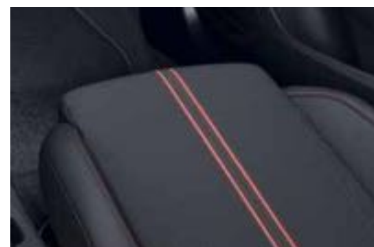
ריפוד בד שחור בשילוב פס אדום – "Banda" לדגמי GS Line