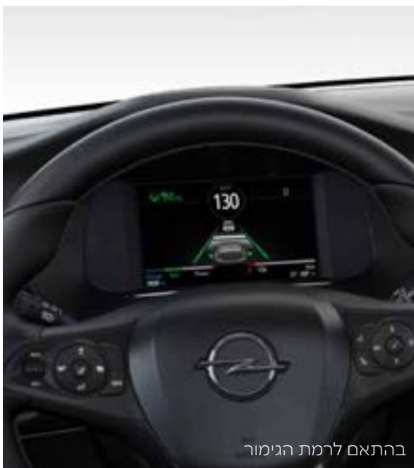
בהתאם לרמת הגימור