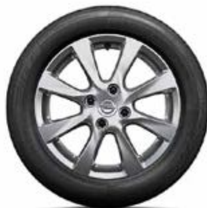
חישוקי סגסוגת 16" לדגמי Edition