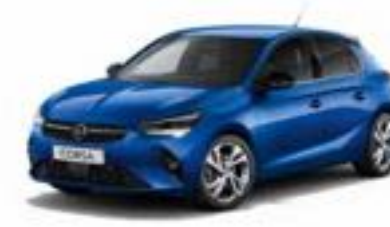
כחול בהיר מטאלי | Voltaic Blue (בדגמי Edition ו-E-Elegance בלבד)