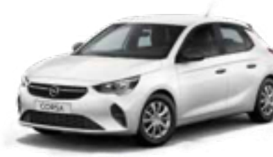
לבן בנקיז | Polar White