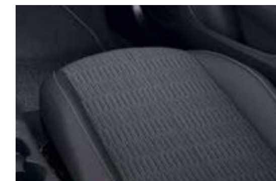
ריפוד בד שחור – "Fresez" לדגמי Edition