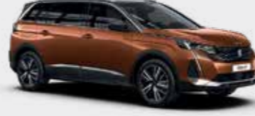
חום מטאלי METALLIC COPPER | LGM0

*צבע מטאלי בתוספת תשלום (למעט כחול בהיר)