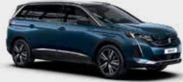
כחול בהיר מטאלי CELEBES BLUE | SYM0