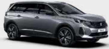
כסוף כהה מטאלי ARTENSE GREY | F4M0

לרשותך עומד מגוון רחב של צבעים שיאפשר לך להביע את עצמך באופן מלא.