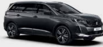
אפור כהה מטאלי PLATINIUM GREY | VLM0