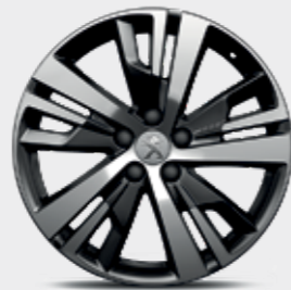
חישוקי סגסוגת 18" DETROIT

*צבע מטאלי בתוספת תשלום (למעט כחול בהיר)