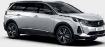
לבן פנינה מטאלי PEARLESCENT WHITE | N9M6