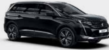
שחור מטאלי BLACK PERLA | 9VM0