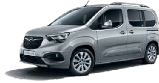
Quartz Grey (G4I) כסף מטאלי*