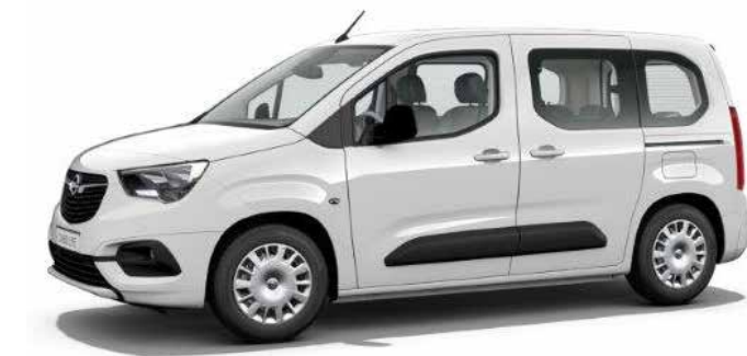
רמת גימור 5 – ENJOY/EDITION PLUS מושבים