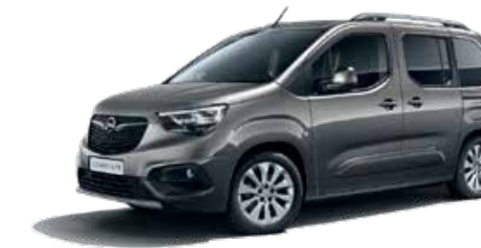
Moonstone Grey (G4O) אפור כהה מטאלי*