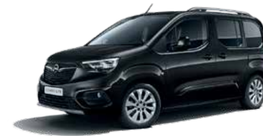
Onyx Black (G7R) שחור מטאלי*