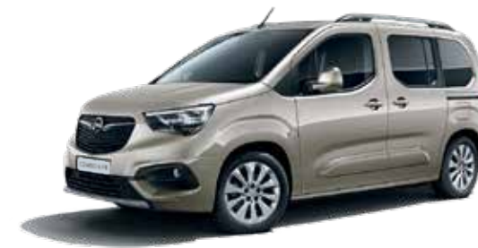
Cool Grey (GAC) בז' מטאלי*