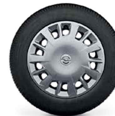
חישוקי פלדה 16" לדגמי ENJOY/EDITION PLUS 5 מושבים