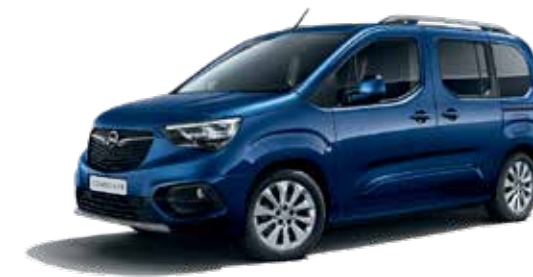
Night Blue (GBT) כחול מטאלי*