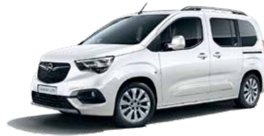
White Jade (G2O) לבן