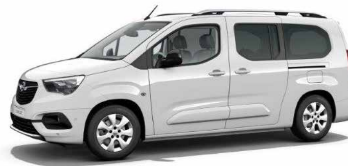
רמת גימור 7 – ELEGANCE PLUS מושבים