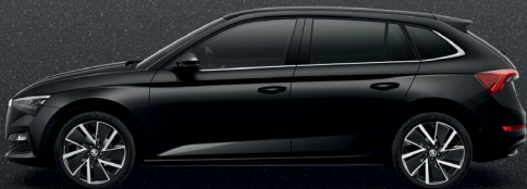
MAGIC BLACK METALLIC