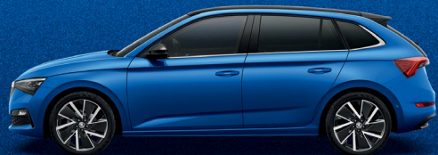
RACE BLUE METALLIC

* ייתכן הבדל בין גוון הצבע הנראה במפרט לבין הגוון בפועל