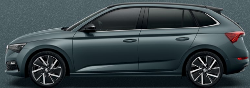
QUARTZ GREY METALLIC