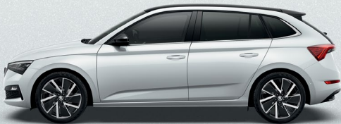
MOON WHITE METALLIC