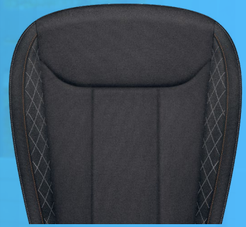
התמונות להמחשה בלבד