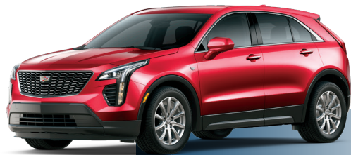
GPJ אדום מטאלי*