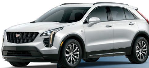
G1W לבן קריסטל*