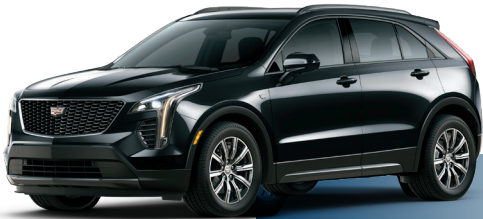
GB8 שחור כוכב מטאלי*