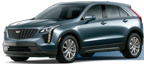
GJ1 אפור מטאלי*