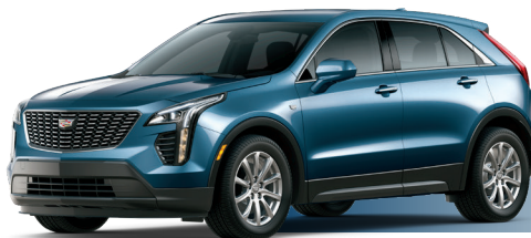
GAO כחול מטאלי*