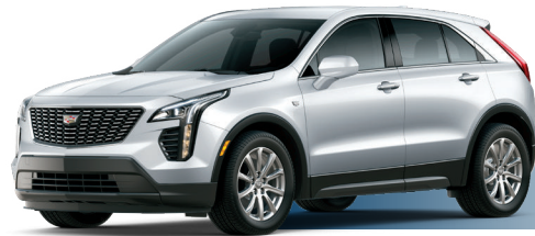
GAN כסף מטאלי