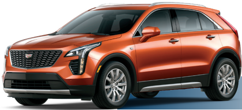
GM6 כתום מטאלי*