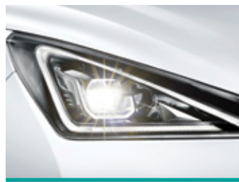
Full Led Technology הכוללת פונקציית Follow me home