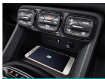
משטח טעינה אלחוטי לטלפון הנייד