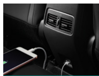
פתחי מיזוג מאחור כולל שקע USB