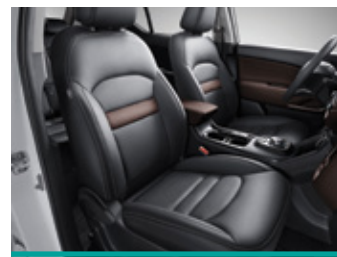
מושב עור, מושב נהג חשמלי, מושבים קדמיים מחוממים