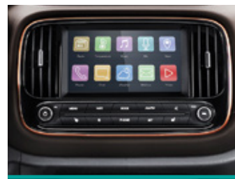
מסך מגע 8" בעברית הכולל: רדיו אינטרנטי, waze, פנגו, סלופארק