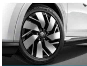
חישוקי סגסוגת קלה בקוטר 18"