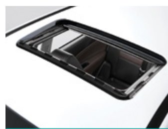
חלון שמש עם וילון אטימה מלאה