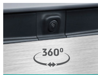
מצלמת 360 מעלות