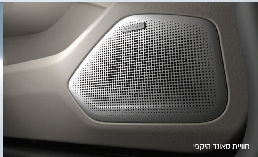
חוויית סאונד היקפי