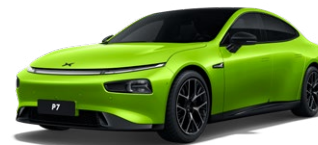
Floating Green *זמין בגרסת Wing Edition