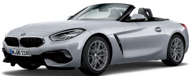
קשתות התהפכות בגימור אלומיניום (Individual Exterior Line Aluminium satinated) וחישוקי 18" דגם V-spoke style 770