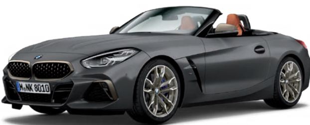
חבילת עיצוב חיצונית M Aerodynamics, קשתות התהפכות בשחור מבריק (Individual high-gloss Shadow Line) פריטי עיצוב חיצוניים ב-Cerium Grey ייחודי, חישוקי 19" דגם Double-spoke style 800 M Bicolor