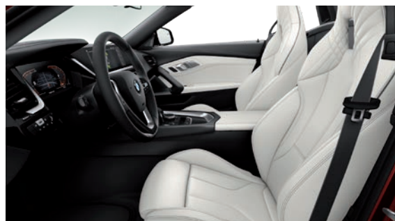
חבילת עיצוב פנימית Sport Line, גימור פנים שחור מבריק וחלק עליון של לוח שעונים ודיפון הדלתות ב-Sensatec