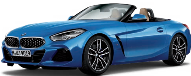
חבילת עיצוב חיצונית M-Sport, קשתות התהפכות בגימור אלומיניום (Individual Exterior Line Aluminium satinated) וחישוקי 19" דגם Double-spoke style 799 M Bicolor