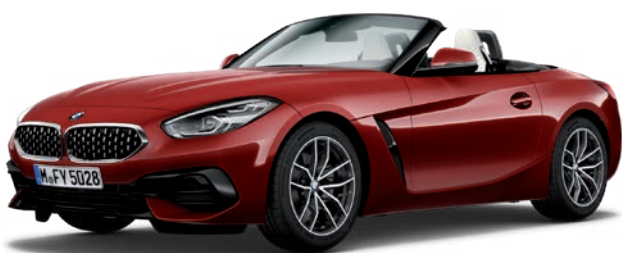
חבילת עיצוב חיצונית Sport Line, קשתות התהפכות בגימור אלומיניום (Individual Exterior Line Aluminium satinated) וחישוקי 18" דגם V-spoke style 770 Bicolor