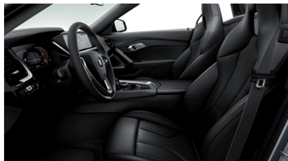
גימור פנים שחור מבריק וריפודי עור Vernasca בצבע שחור