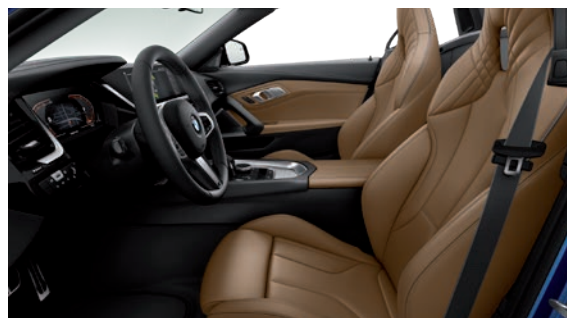
חבילת עיצוב פנימית M-Sport, גימור פנים אלומיניום וחלק עליון של לוח שעונים ודיפון הדלתות ב-Tetragon Sensatec