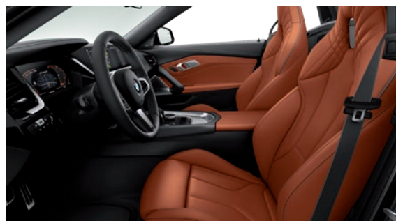
גימור פנים אלומיניום וחלק עליון של לוח שעונים ודיפון הדלתות ב-Tetragon Sensatec