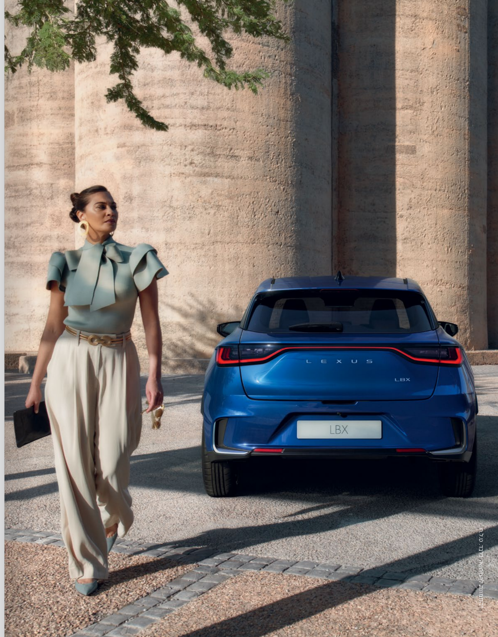
התמונה לרקמת שיווק. טל. 11