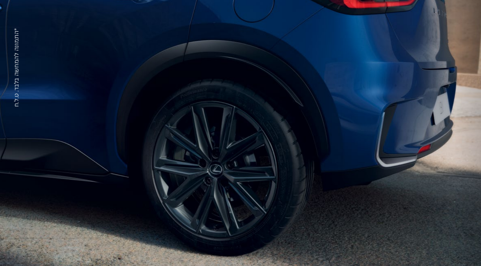
*התמונה להמחשה בלבד. ט.ל.ח.