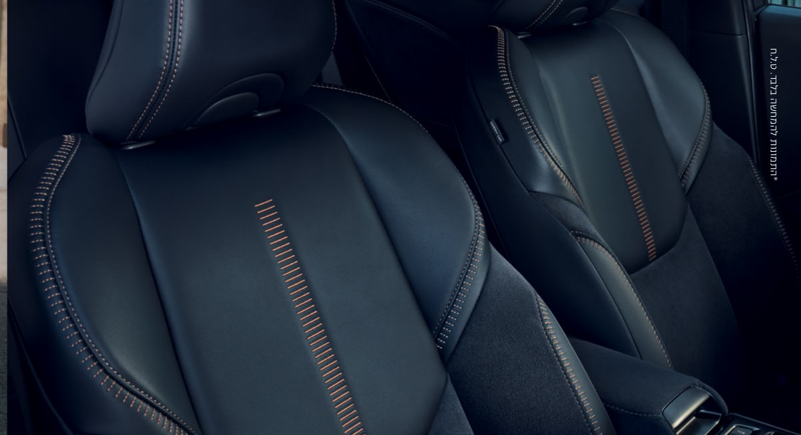
*התמונה להמחשה בלבד. ט.ל.ח.