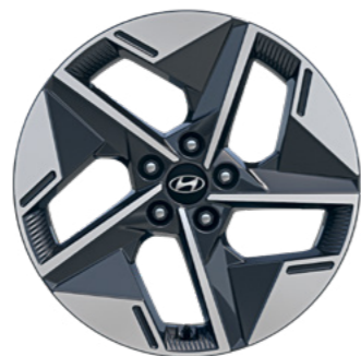
חישוקי סגסוגת בקוטר 18" (Premium, Panoramic)