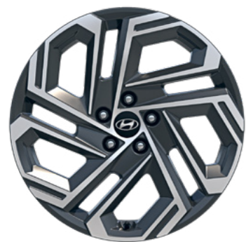
חישוקי סגסוגת בקוטר 19" (Luxury + Elite)