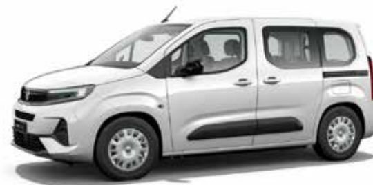
Icy White לבן