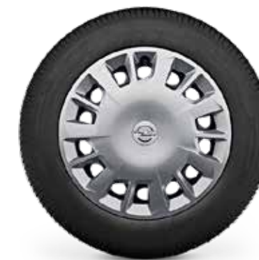
חישוקי פלדה 16" לדגמי EDITION PLUS 5 מושבים