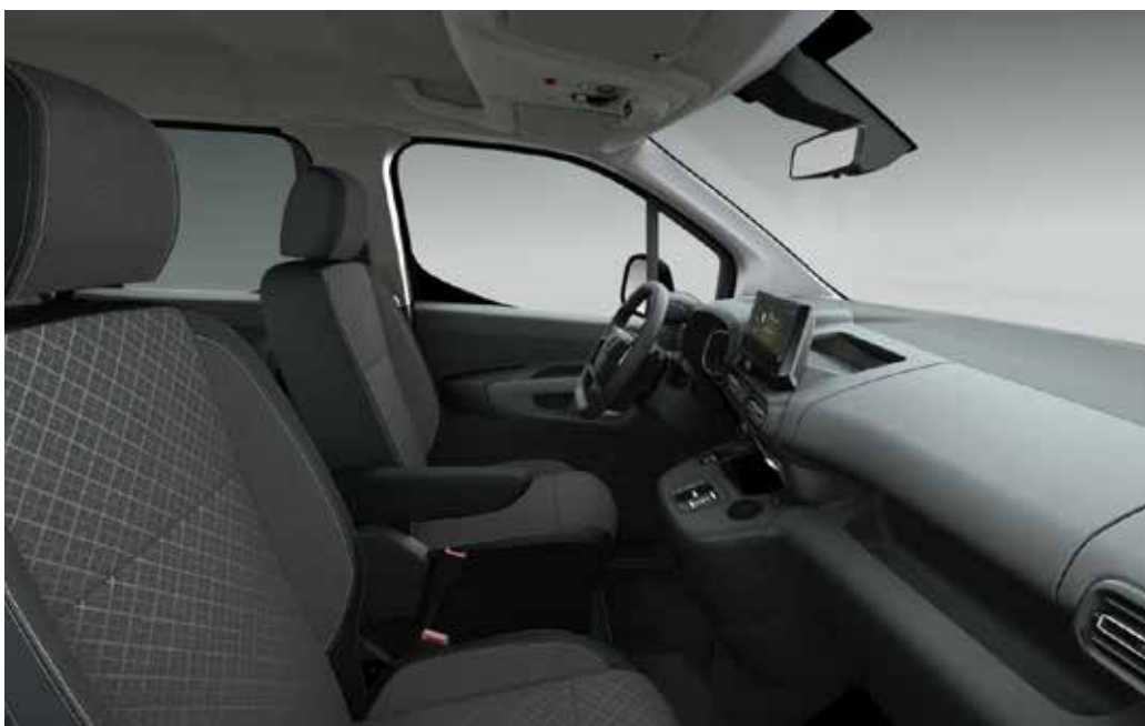
ריפוד בד בצבע אפור משולב עם שחור