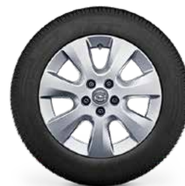
חישוקי סגסוגת 16" לדגמי ELEGANCE PLUS 7 מושבים