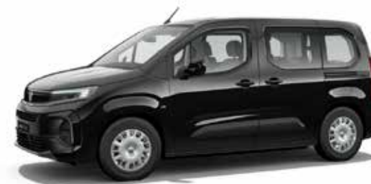
Perla Black שחור מטאלי