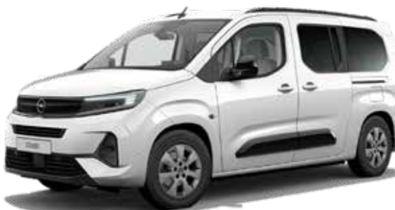
רמת גימור ELEGANCE PLUS – 7 מושבים