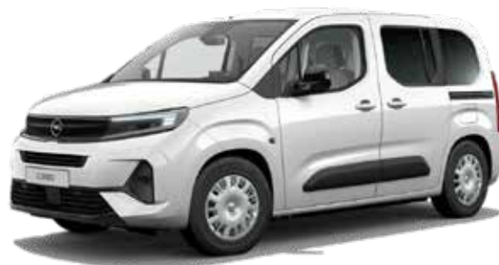
רמת גימור EDITION PLUS – 5 מושבים