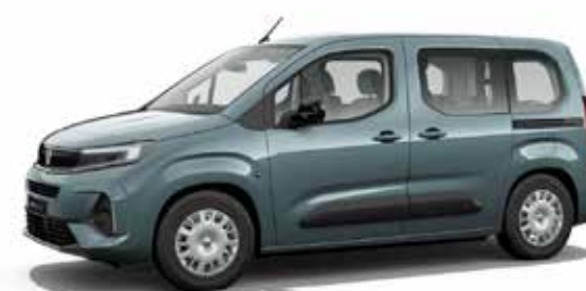
Libeccio Blue כחול מטאלי