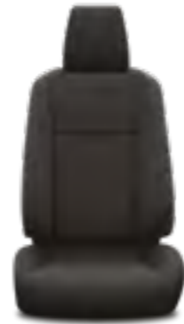
ריפודי בד בצבע שחור דגמי ACTIVE