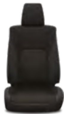
ריפודי בד מהודרים בצבע שחור דגמי ADVENTURE+, ACTIVE+

**מומלץ לבדוק את תאימות הטלפון הנייד שברשותך למערכת ה-Bluetooth המותקנת ב-HiLUX, אשר הינה מסוג: Toyota Touch 2. את הבדיקה ניתן לעשות בלינק הבא: www.toyota-tech.eu/bluetooth/search.aspx ***נכון למועד פרסום קטלוג זה, אפליקציית Android Auto אינה זמינה בישראל.