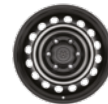
חישוקי פלדה 17" עם צלחות כיסוי דגמי ACTIVE