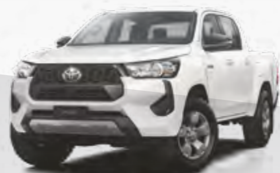
לבן צחור 040