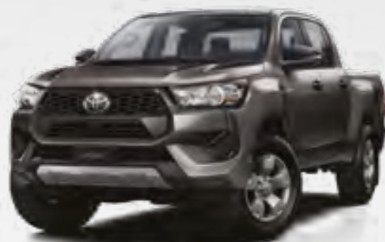
אפור כהה מטאלי 163