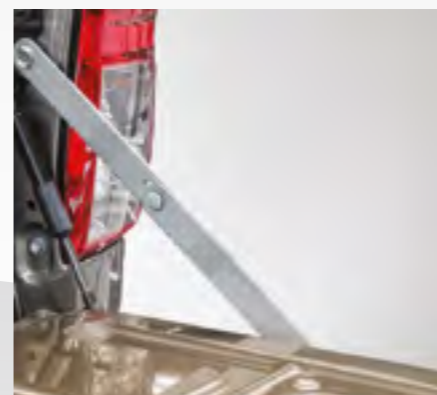
קשת הגנה דקורטיבית לארגז בצבע שחור