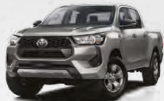
כסוף מטאלי 110