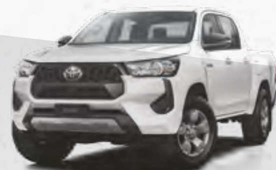
לבן פנינה מטאלי 089

אמבטיה לתא המטען, וו גרירה, קשת דקורטיבית ובולם שיכוך לדלת האחורית