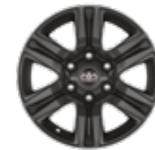
חישוקי סגסוגת קלה 17" בצבע שחור דגמי ADVENTURE+, ACTIVE+