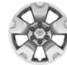
חישוקי פלדה 17" עם צלחות כיסוי דגמי ACTIVE