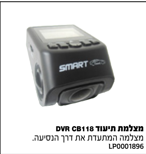
מצלמת תיעוד DVR CB118 מצלמה המתעדת את דרך הנסיעה. LP0001896