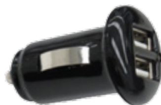
מטען מצת 2.1 אמפר 2 כניסות USB להטענת כל סוגי המכשירים. LP00007192