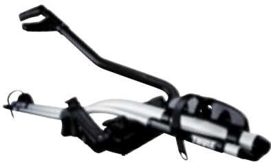
מנשא אופניים THULE אלומיניום דגם 591 לאופניים עם קוטר שלדה בין 22 ל-80 מ"מ. LP00007132