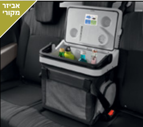
קירורית ניידת 20 ליטר , חיבור למצת הרכב, 12 וולט. LP00011541