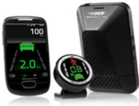
מערכת מובילאיי מערכת חכמה למניעת תאונות דרכים. LP00013335

אתה מוזמן לאבזר את הרכב שלך ולהפוך אותו לייחודי, עם מגוון אביזרים לבחירה: