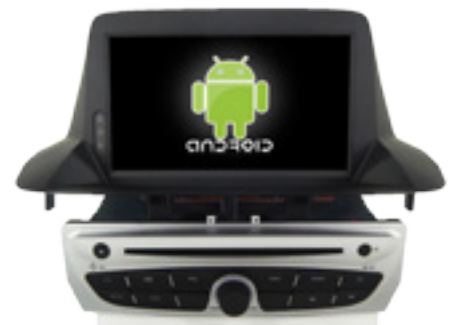
מערכת מולטימדיה עם מערכת הפעלה אנדרואיד. LP00013502