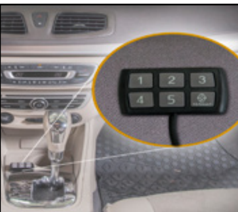
קודן משבת התנעה חכם למניעת גניבות. LP00000045