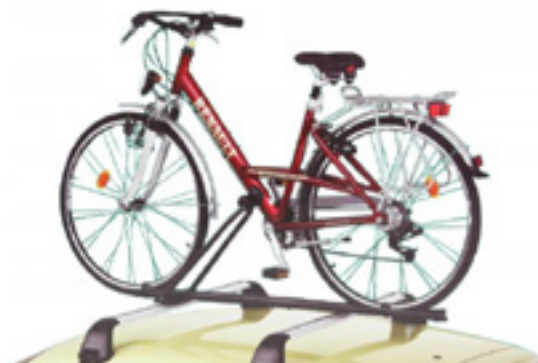
מנשא אופניים פלדה MONT BLANC לאופניים עם קוטר שלדה בין 22 ל-65 מ"מ. LP00007131