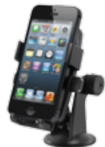
תושבת איכותית לסמארטפון נצמדת לשמשה/לדשבורד, תמיכה במכשירים עד 5 אינץ'. LP00007190

האביזרים המופיעים בעמוד זה הינם בתשלום נוסף.