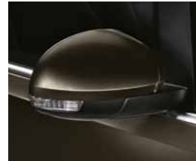
שחור חציל (0000)