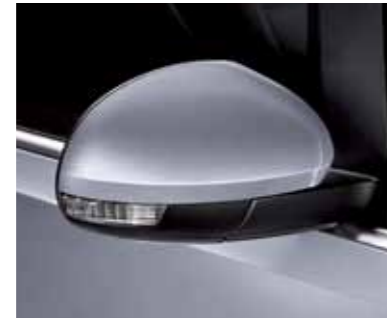
כסף תכלית (9019)