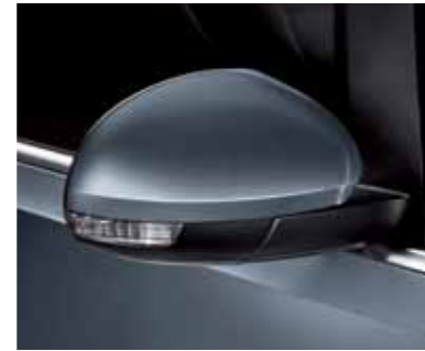
אפור כהה (3333)