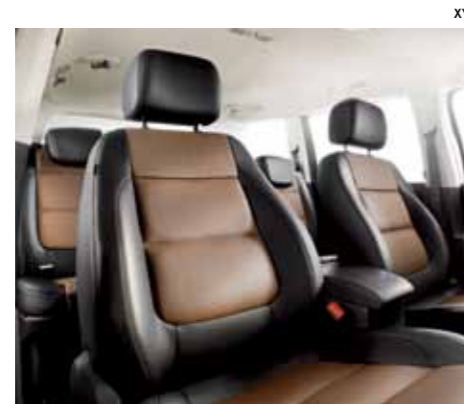
עור שחור חום