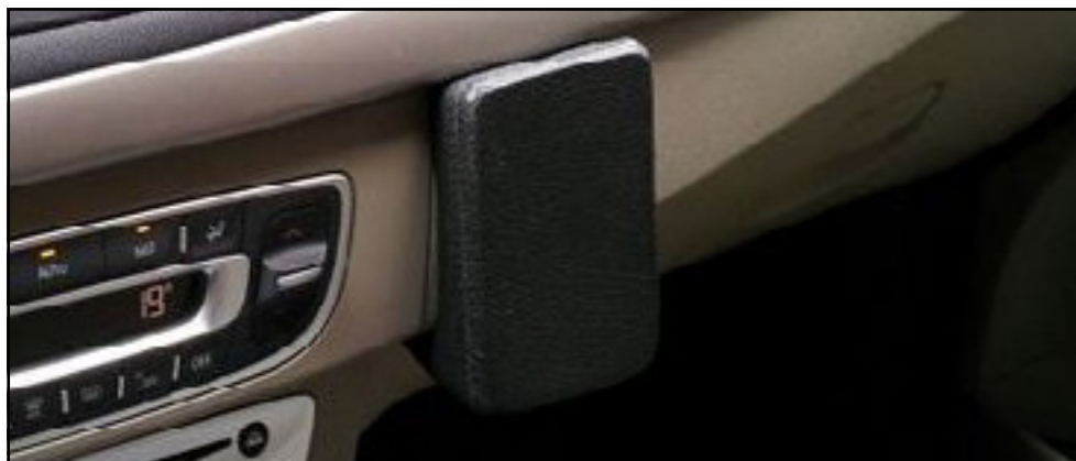
תושבת (כרית) דמוי עור להתקן טלפון סלולרי או טלפון קבוע לרכב LP00006944