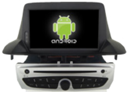
מערכת מולטימדיה עם מערכת הפעלה אנדרואיד. שחור LP000013369, חום LP00013419