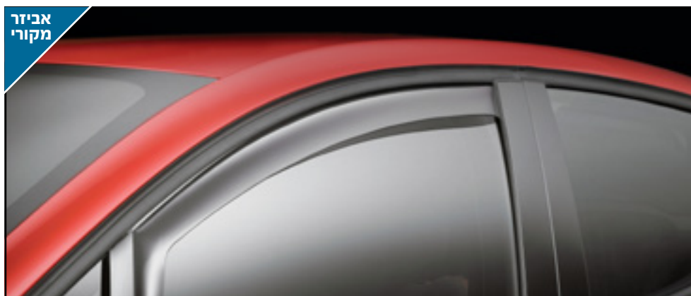
זוג מסיטי רוח קדמיים לנהיגה בנוחות מלאה עם חלונות פתוחים. LP00008483